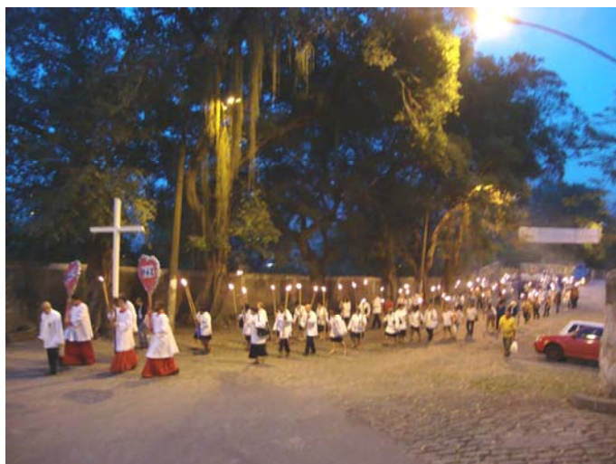
Figura 8: Procissão de abertura da Festa

passado, exceto pela tentativa de reconquista, pela comunidade, do espaço antes tomado pela violência.